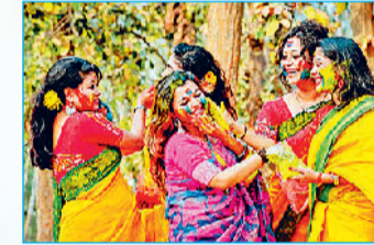
बंगाल की पारंपरिक अबीर होली

बदल गया पर्व का स्वरूप: समय के साथ-साथ होली का स्वरूप बदलता गया और लोग इससे बचने लगे हैं। विकृत स्वरूप के कारण रंगों का चलन कम हो गया है और केवल थोड़े-बहुत अबीर का