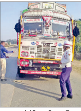
चालान करते ट्रैफिक पुलिसकर्मी।