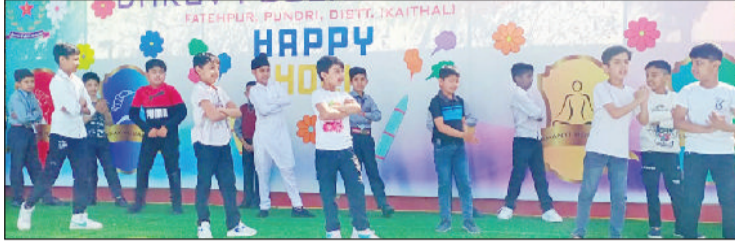
कैथल। कार्यक्रम के दौरान प्रस्तुति देते ध्रुव स्कूल पूंडरी के विद्यार्थी।