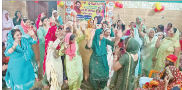
जीद। आहलूवालिया भवन में होली पर नृत्य करती हुई महिलाएं।

का सामना कर रहे हैं। अब ये बेरोजगारी युवाओं के लिए एक दिन गिन-गिन कर काट रहे हैं। उन्होंने कहा कि आज पूरा प्रदेश बीजेपी के कुशासन, भ्रष्टाचार, महंगाई, बेरोजगारी और बढ़ते अपराध से परेशान है।