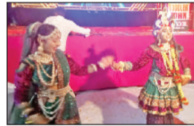
गुहला-चीका। सांस्कृतिक कार्यक्रम के दौरान राधा कृष्ण की झांकी प्रस्तुत करते बच्चे।