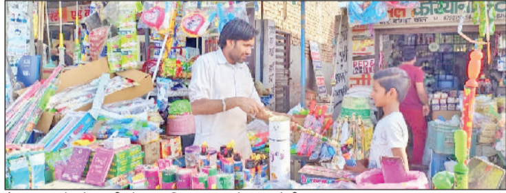
कैथल। राजौंद के पूंडरी चौक पर स्थित दुकान में सजा होली का सामान।