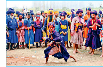
आनंदपुर साहिब में होला मोहल्ला

पूर्णिमा का त्योहार होली, थोड़ी-बहुत भिन्नता के साथ देश भर में मनाई जाती है। ब्रज की लड्डुमार, फूल और गुलाल की होली के सप्ताह भर के आयोजन से हममें से अधिकतर परिचित हैं। उत्तराखंड में कुमाऊं की होली के कई दिन पहले से गीत बैठकी में शास्त्रीय संगीत की मंडली जमने लगती है। महाराष्ट्र में शिमगा की रात को हर दिन में लोग पूरन पोली बनाते हैं, सूखे गुलाल की होली खेलते हैं। कर्नाटक में सिरसी में, होली से पांच दिन पहले बेदरा वेशा लोकनृत्य होता है। तेलंगाना में होली 10 दिन पहले शुरू हो जाती है। पंजाब के आनंदपुर साहिब में होला मोहल्ला में सिख धर्मावलंबी शक्ति प्रदर्शन करते हैं और रंग की जगह कलाबाजी, कुश्ती, मार्शल आर्ट आदि का प्रदर्शन करते हैं। मध्य प्रदेश में खासकर भोपाल-इंदौर में, होली के बजाय होली के अगले दिन की रंगपंचमी खास