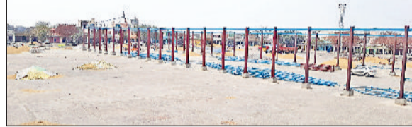
जींद। अनाजमंडी में चल रहा शेड का निर्माण कार्य। फोटो: हरिभूमि

गेहूं कटाई में अभी थोड़ा सा समय और लेगा। गेहूं की कटाई एक अप्रैल के बाद ही शुरू होगी। इस समय खेतों में सरसों की कटाई का कार्य चला हुआ है लेकिन मंडी में सरसों की सरकारी खरीद नहीं हो रही है। सरसों का एमएसपी 5656 रुपये तय किया है लेकिन इस समय जो सरसों मंडी में आ रही है, उसको निजी खरीददार व मिल मालिक पांच हजार के आसपास खरीद रहे हैं। ऐसे में किसानों को साढ़े 600 रुपये का घाटा हो रहा है। अनाज मंडियों में सरसों की सरकारी खरीद हैफेड द्वारा की जाएगी। 26 मार्च के बाद मंडी में आने वाली सरसों को एमएसपी पर खरीदा जाएगा। मंडियों में फिलहाल बारदाना भी नहीं पहुंचा है।