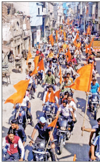
जीद। जयति-जयति हिंदू महान संगठन द्वारा शहर में निकाली गई श्रद्धांजलि बाइक यात्रा।