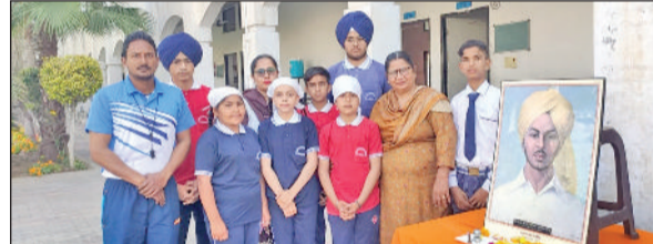
गुहला-चीका। शहीद भगत सिंह को याद करते कोहिनूर एकेडमी के विद्यार्थी

शहीदी दिवस के अवसर पर टटियाना स्थित कोहिनूर इंटरनेशनल एकेडमी के प्रांगण में श्रद्धांजलि कार्यक्रम का आयोजन किया गया जिसके अंतर्गत बच्चों को भाषण द्वारा शहीद भगत सिंह के जीवन वृत्तों से परिचित करवाते हुए उनके बचपन से ही क्रांतिकारी विचारों, देशभक्ति, आत्मसमर्पण व बलिदान से परिचित करवाया गया। तदुपरांत उन्हें श्रद्धांजलि देते हुए बच्चों ने एकल व समूह गायन, गीत व कविता पाठ किए। उनके जीवन व देशभक्ति से प्रेरित बच्चे भक्त सिंह