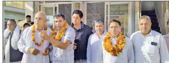
कलायत। अनाज मंडी में दो खेमों द्वारा अलग-अलग चुने गए प्रधान व उप प्रधान