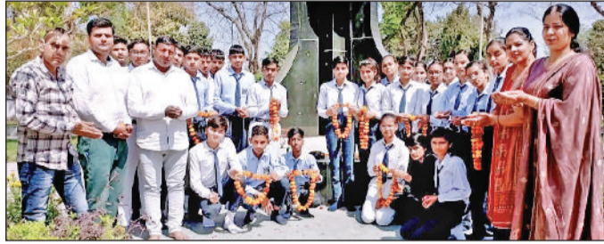
जीद। शहीदी स्मारक पर शहीदों को नमन करते डीएन मॉडल स्कूल के बच्चे व रटाफ।

सुखदेव जैसी देश भक्त विभूतियों के जीवन दर्शन को अपने जीवन में आत्मसात करना चाहिए। बाद में बाइक रैली रेलवे जंक्शन से शुरू होकर पटियाला चौक, रानी तालाब, गोहाना रोड से होती हुई शहीद स्मारक पहुंची। रैली के दौरान इंकलाब जिंदाबाद, जय श्री राम और वंदे मातरम के नारे लगाए गए और देशभक्ति के गीत सुनाए गए। शहीद स्मारक पर युवाओं ने शहीदों को नमन किया और उनके बताए रास्ते पर चलने की शपथ ली। उन्होंने कहा कि इस श्रद्धांजलि यात्रा में हजारों युवाओं ने भाग लेकर शहीदों को नमन किया है। संगठन द्वारा पिछले दस सालों से श्रद्धांजलि बाइक यात्रा का आयोजन किया जा रहा है जिसमें हर बार हजारों की संख्या में युवा पीढ़ी को शहीद भगत सिंह, राजगुरू,